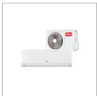
Ar Condicionado Semp TCL 18000 BTUs - TAC-18CTG2