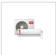
Ar Condicionado Split Semp TAC-12CSA1 Frio 220v