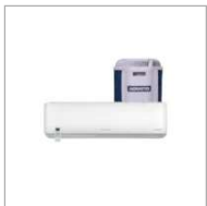
Ar Condicionado Agratto Sp BTUs - LCST9F-02I 220V