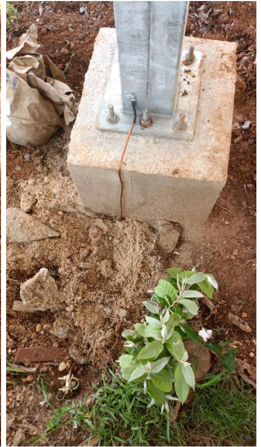
Aterramento Pilares Estrutura Carport