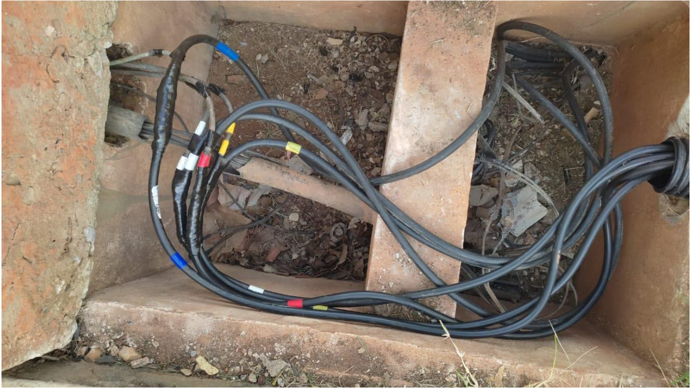
Conexões c/ conectores tipo "luvas" prensado com alicate hidráulico