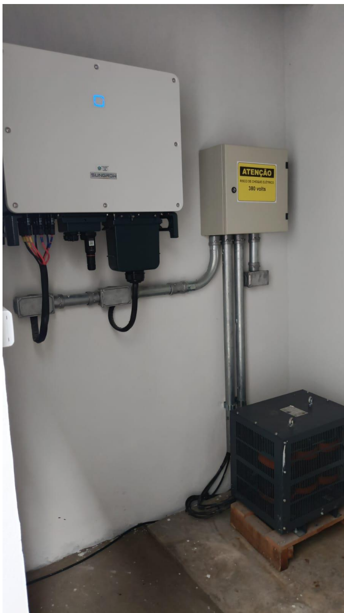
SUN GROW SG 33CX TRIFÁSICO E AUTOTRANSFORMADOS TRIFÁSICO 30KVA EIKON