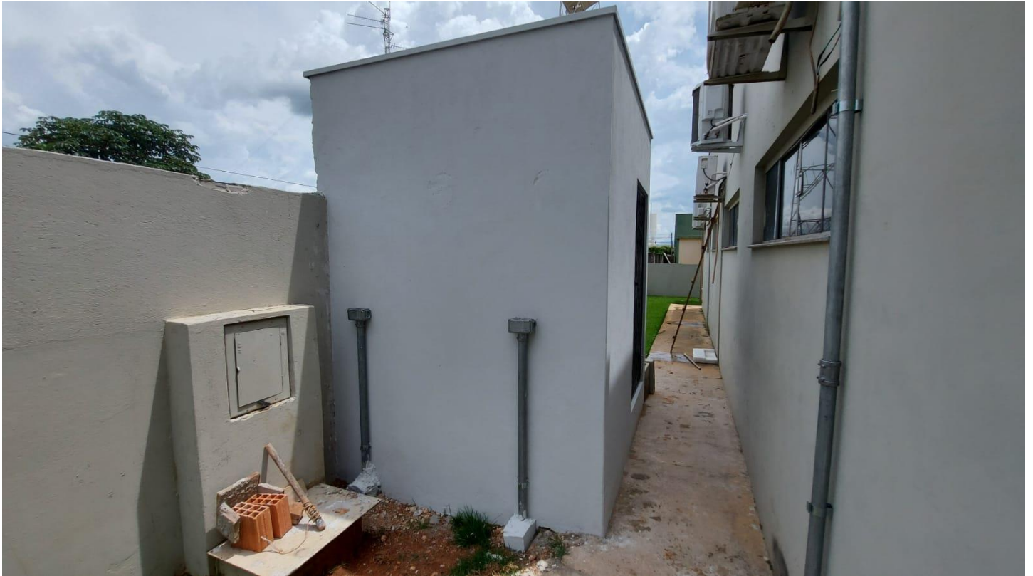
| Casa Abrigo Finalizada, com pintura branca, grade de proteção de entrada