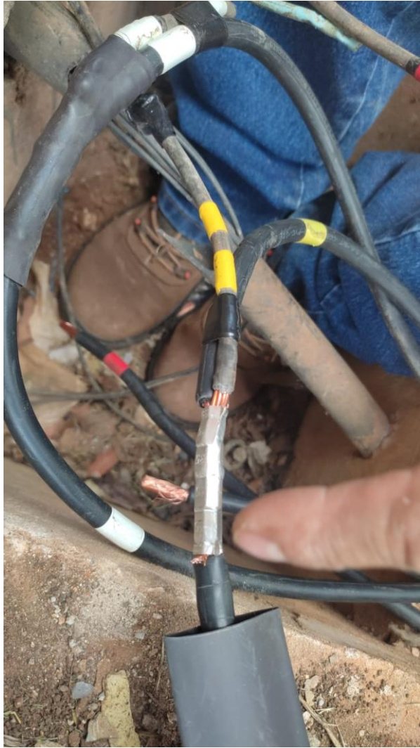
Conexões c/ conectores tipo “luvas” prensado com alicate hidráulico