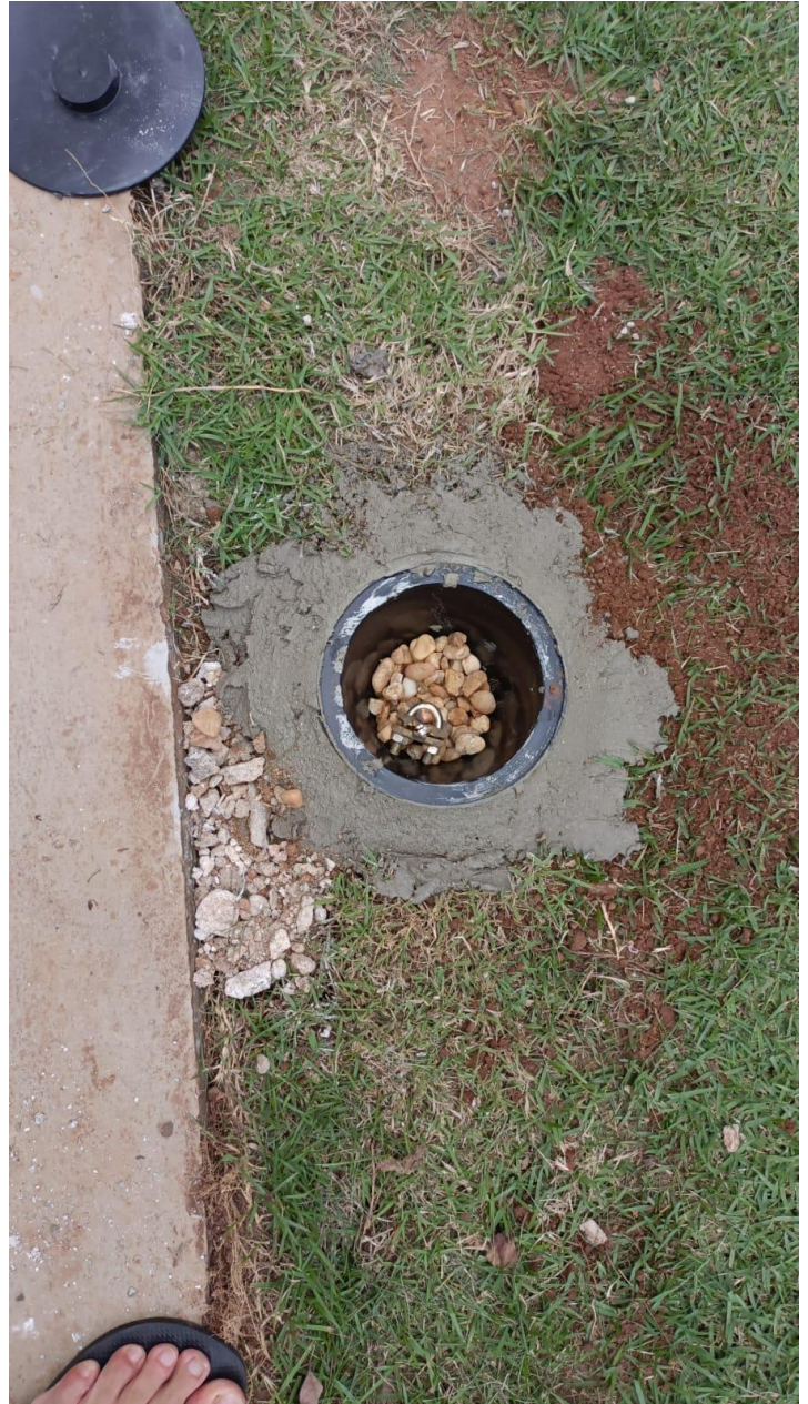
Caixa de Inspeção Aterramento (Lateral Casa Abrigo)